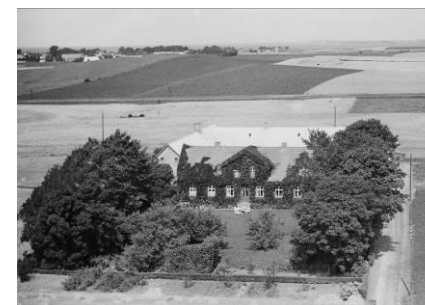
Matr. nr. 4. Læsagergård. 1953. Blev udflyttet efter brand i 1900,