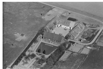
Matr. Nr. 3. Olshøjgaard. 1936-38

2 gårde er ved udflytning fra landsbyen placeret nord for jernbanelinien, der som bekendt blev anlagt i 1856.