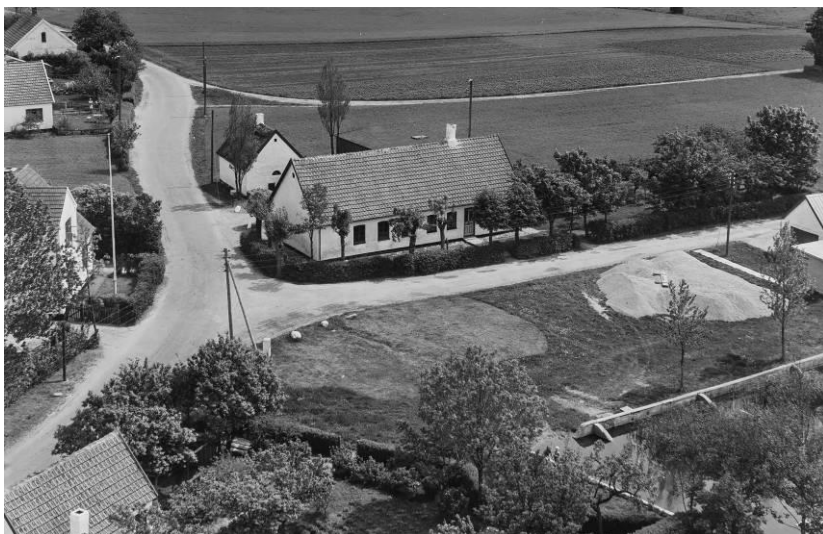
Gadekærpladsen 1955 med vejviserstenen ved lysmasten.

Landsbyen med gadekæret var før i tiden samlingspunkt for gårde og huse i Halseby. Her lå "Sprøjtehuset" og "Fryseboksen" blev siden placeret her.