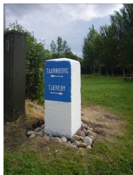
Vejviserstenen står stadig på sin plads ved gadekæret