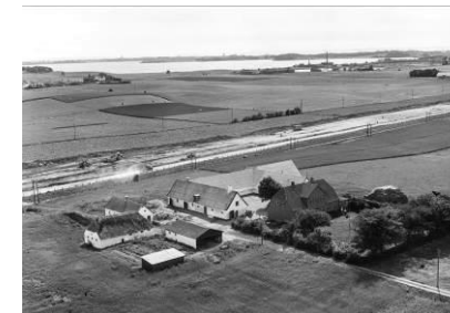
Matr. nr. 2. (Helge Olsen) 1956