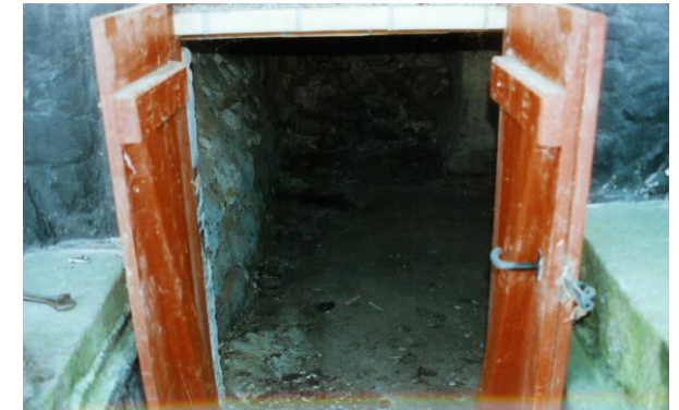
Nedgangen til fangekælderen