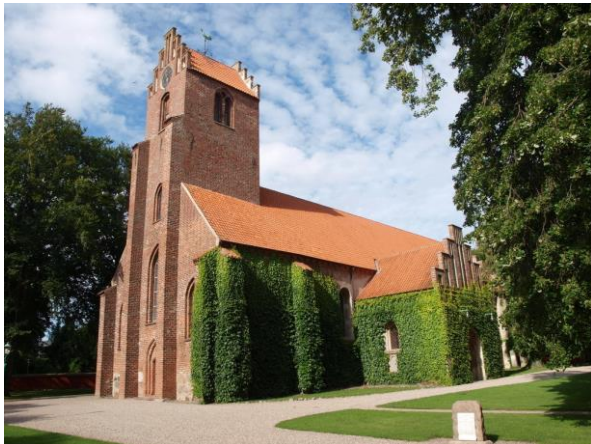
Sankt Nicolai Kirke.