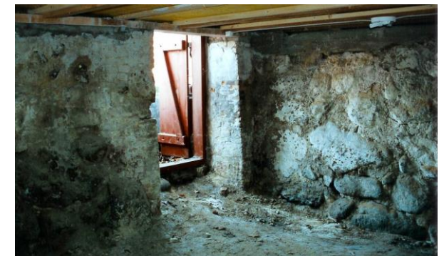
Ja, hyggeligt er her jo ikke.