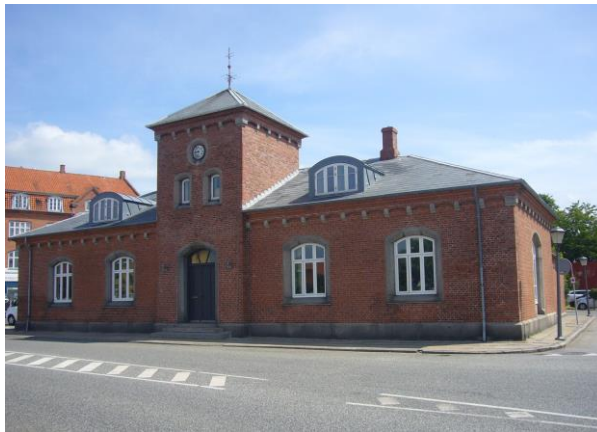
Det gamle Toldkammer