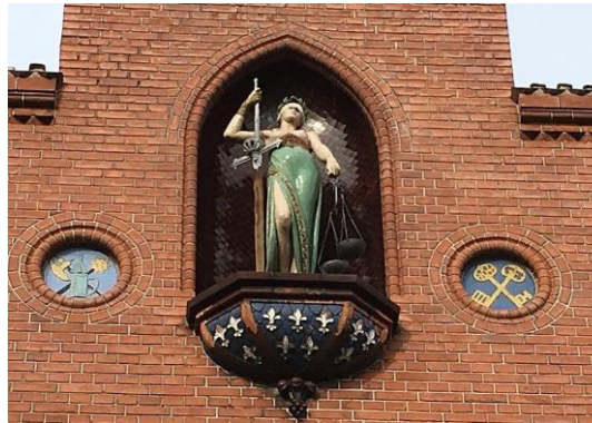
"Fru Justitia" med vægt og sværd.