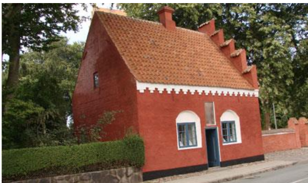
Den gamle Latinskole