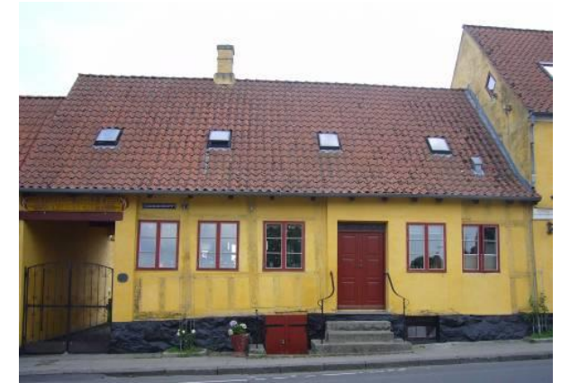
I det gamle rådhus sad de tre dømtede for mordet på Sognefogeden i Frølund