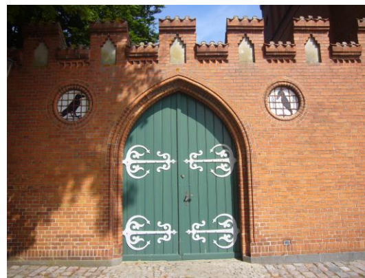
Er man fuld som en alk, og stjæler man som en ravn, kommer man bag tremmer.