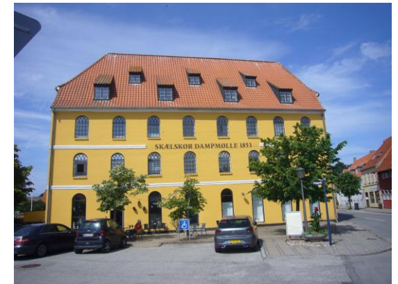
Den gamle Dampmølle.