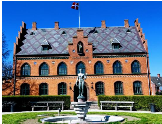
Rådhuset fra 1896