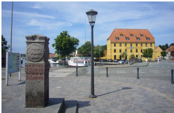
Skælskørstenen - Nulpunktstenen