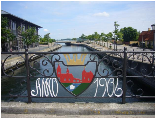
Broen over indløbet til Noret.